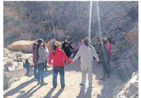
HUBO UNA MUY BUENA ACOGIDA Y EVALUACIÓN.