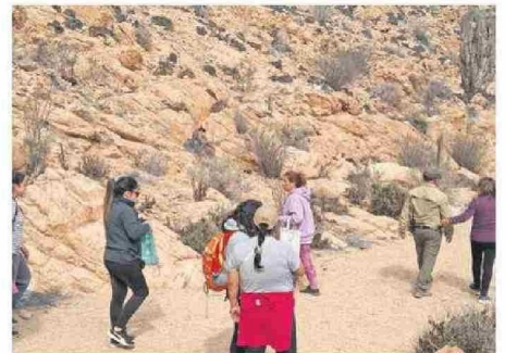
ES UN SERVICIO COMPLEMENTARIO A LA SALUD TRADICIONAL.