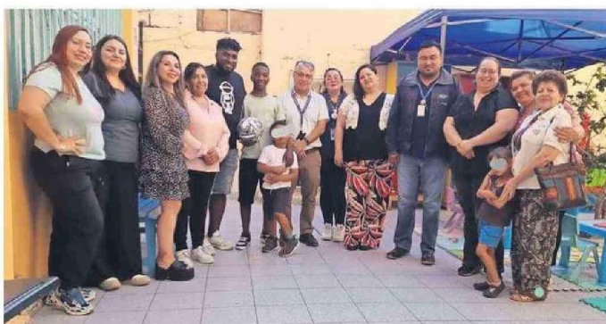
LA EMOTIVA DESPEDIDA EN LA RESIDENCIA FAMILIAR ANTES DE VIAJAR A SANTIAGO.