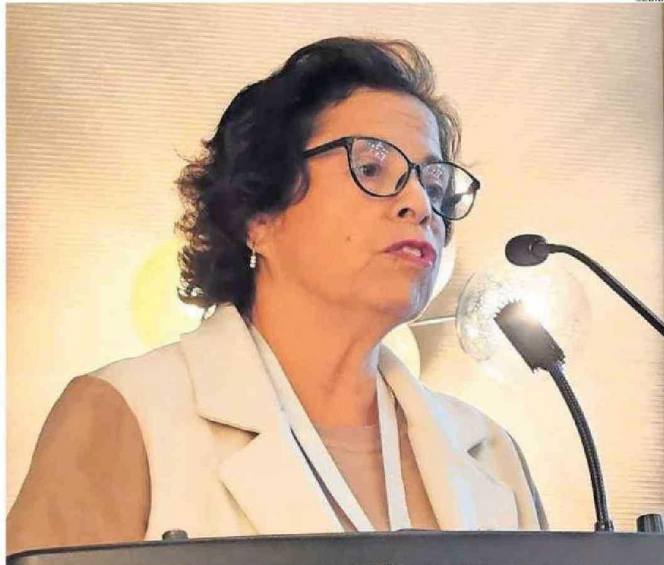
LA MINISTRA ENTREGÓ LA OPINIÓN DEL MINISTERIO DURANTE LA ÚLTIMA SESIÓN DE LA COMISIÓN DE MINERÍA.

“Para hacer la diferencia, prosiguió, el litio presente en roca tiene un procedimiento parecido al cobre, donde hay que separar el mineral de la roca. En nuestro país está presente en fluido, esto significa que el fluido está en movimiento. Por ende, el primer argumento es que hay una incompatibilidad entre el régimen jurídico de concesión minera versus la forma en cómo el litio se presenta en la naturaleza”.