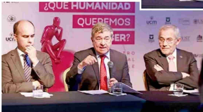
El senador Juan Antonio Coloma en su rol de presidente de la Comisión Desafíos del Futuro, Ciencia, Tecnología e Innovación de la Cámara Alta, afirmó que el encuentro planteará cómo se armoniza la tecnología de la información con nuestro desarrollo.