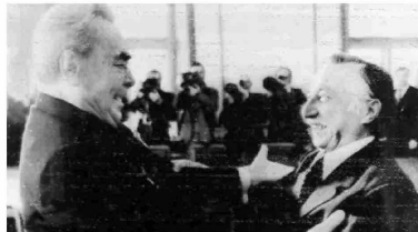
Luis Corvalán , secretario general del PC chileno, es recibido en Moscú por el secretario general del PC de la URSS, Leonid Brézhnev.