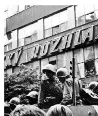
En agosto de 1968 las tropas soviéticas invadieron Checoslovaquia.