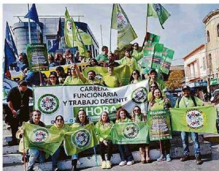
HOY A LAS 10 DE LA MAÑANA HARÁN DENUNCIA Y CONFERENCIA.