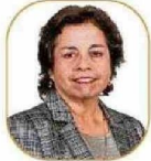
Aurora Williams Ministra de Minería