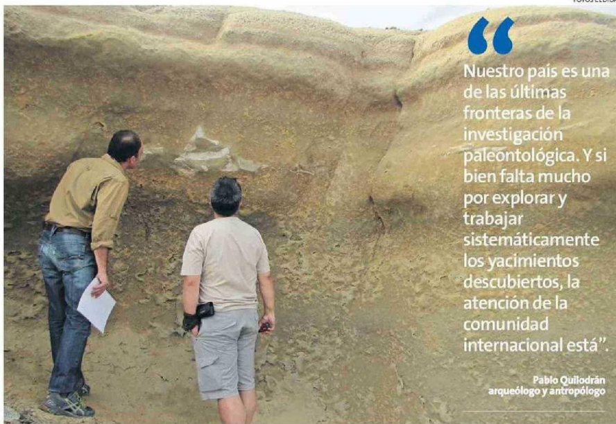
BAHÍA INGLESA ES UNO DE LOS SITIOS FOSILIFEROS MÁS IMPORTANTES DEL PAÍS.

Probablemente, no hay historia más significativa para toda la humanidad y para todos nosotros que la historia de cómo nos transformamos en lo que somos. Y no hablo sólo de la humanidad, hablo