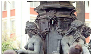
ANTES.— La estructura lucía sus figuras, que habrían sido robadas por encargo, según expertos. El municipio aún no se querrela, reclama concejal.