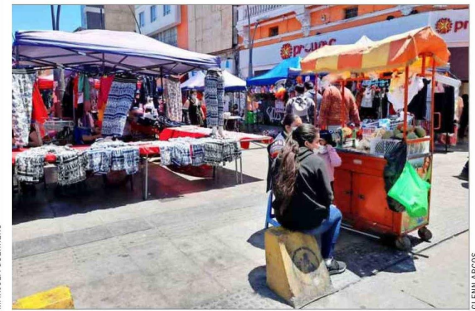
En el comercio (-5,8%) y en otras actividades de servicio (-12,9%) es donde mayormente disminuyó la informalidad el último trimestre de 2024.

CARMEN CIFUENTES, INVESTIGADORA CLAPES UC