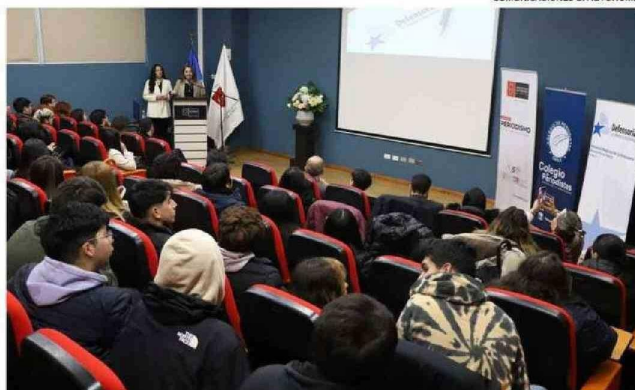
EL CONVERSATORIO SE REALIZÓ EN EL AUDITORIO “ANDRÉS BELLO” DE LA SEDE TEMUCO DE LA AUTÓNOMA.

“Agradecemos la invitación del Colegio de Periodistas y de