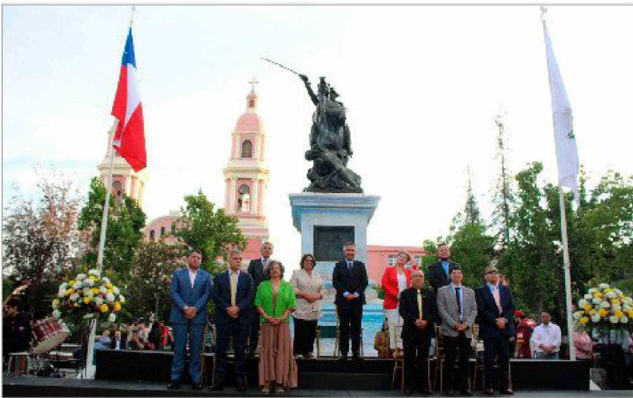
El nuevo alcalde de Rancagua, Raimundo Agliati tomó el mando junto a los concejales de la cámara municipal.