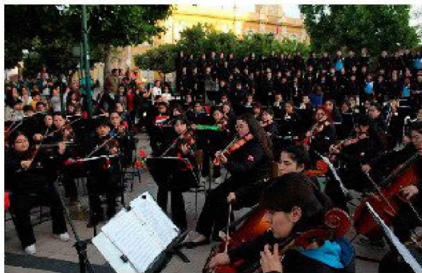
El Coro de la Orquesta Comunal de la Corporación Municipal, junto a la Orquesta Sinfónica del Liceo Óscar Castro Zúñiga dieron el toque cultural al acto.