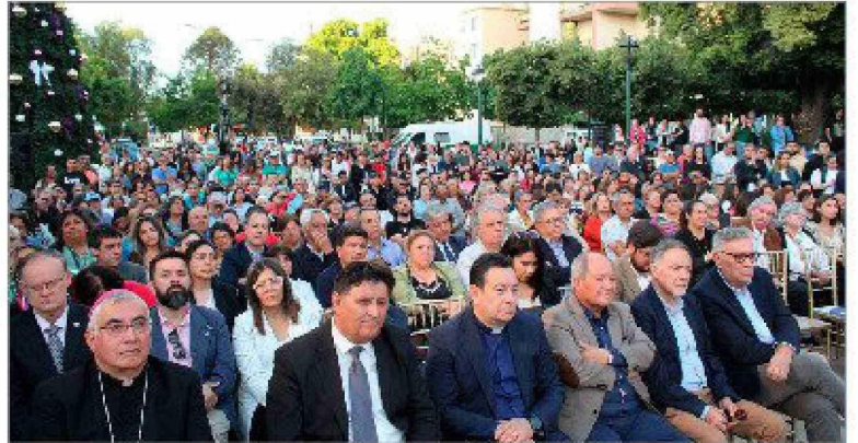
Una gran asistencia de invitados y público en general para la toma de mando del nuevo alcalde de Rancagua.

ron palabras y oraciones, al mismo tiempo pedirle a Dios, bendición a todos los presentes y a las nuevas autoridades comunales, que desde hoy asumen al poder para enrumbar a Rancagua hacia un mundo mejor.