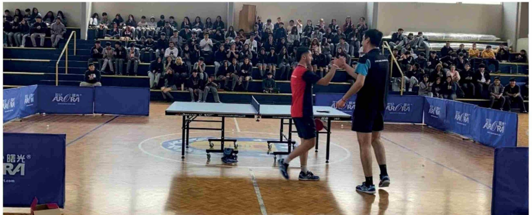
CON CERCA DE 300 ESCOLARES se dio el vamos al club TTC Los Ángeles, en el gimnasio de la U de Concepción.