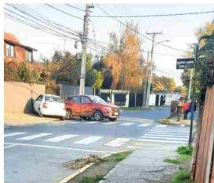
La intersección de Merino Jarpa y Membrillar, se ha transformado en la "esquina del peligro".