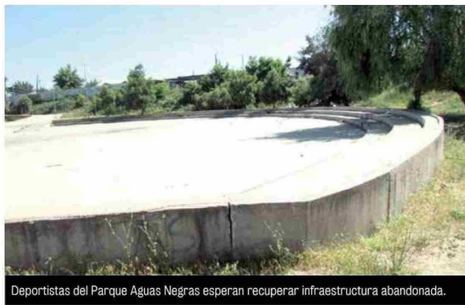
Deportistas del Parque Aguas Negras esperan recuperar infraestructura abandonada.