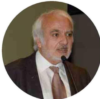
▣ Rubén Alvarado, presidente Ejecutivo de Codelco.