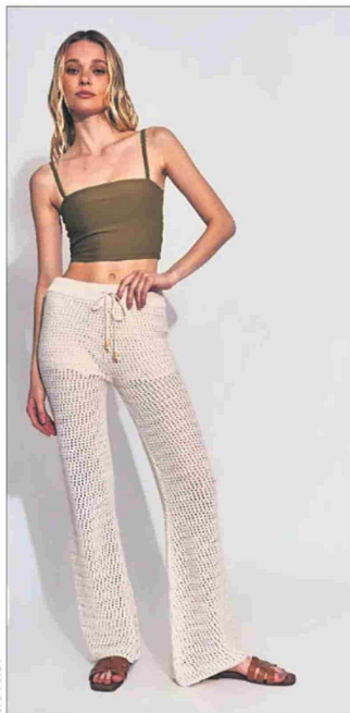
Este modelo cuesta $21.990 en Ripley.

Diseñador de vestuario dice que se deben lavar después de cada postura, para que no pierdan el color.