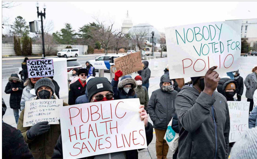
Investigadores y sociedad civil protestaron fuera de las oficinas del Departamento de Salud y Servicios Humanos hace un par de semanas para rechazar los recortes a la ciencia que impulsó el gobierno de EE.UU.