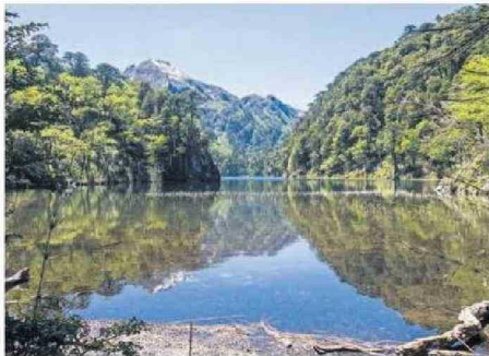
LOS LAGOS FUE LA ZONA QUE MÁS CRECIÓ EN EL PAÍS.

Las regiones que han tenido un crecimiento notable en estos viajes intrarregionales al cierre del primer semestre de 2024 incluyen Los Lagos, con un aumento del 20% en reservas, seguido de Co-