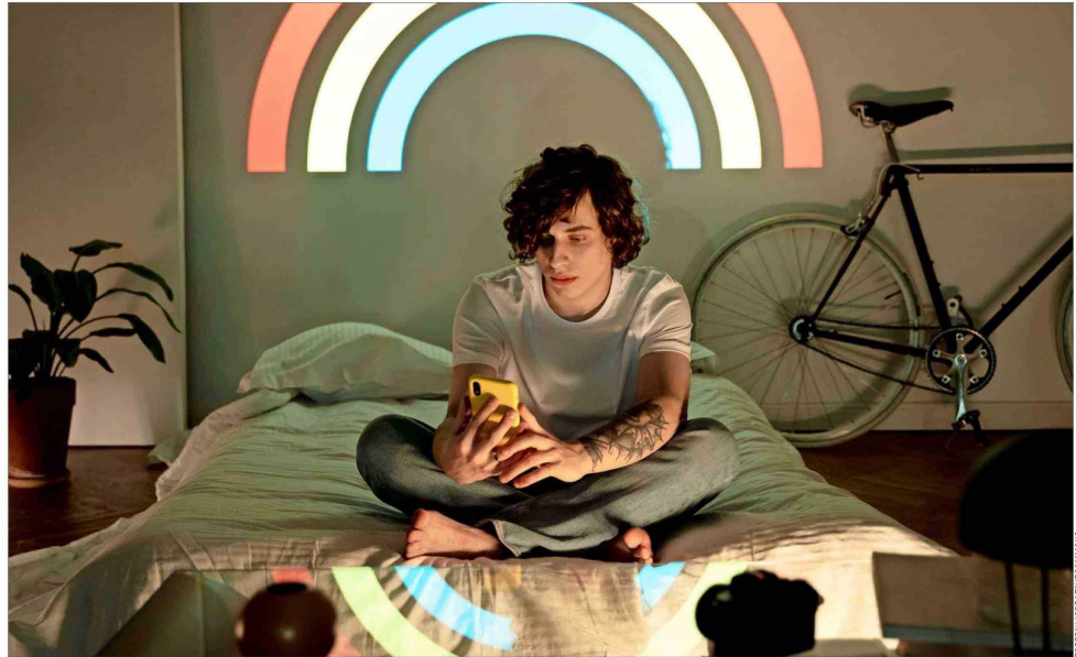
Múltiples estudios indican que los jóvenes prefieren chatear o navegar por internet antes que salir de noche.

"Estamos ante un cambio cultural. Esta es una generación