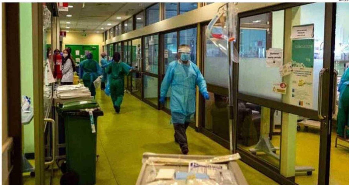
LA DEMORA EN LA ATENCIÓN DE SALUD REQUERIDA POR LAS PERSONAS, ES UNA DE LAS DIFICULTADES EVIDENCIADAS POR EL SERVICIO DE SALUD.

“Aquí claramente se evidencia una falta de gestión y deficiencia en el uso de los recursos para dar atención oportuna en salud a los habitantes de la zona sur de nuestra región, que incluye las comunas de Puerto Varas, Frutillar, Llanquihue, Los Muermos y Fresia que represento”.