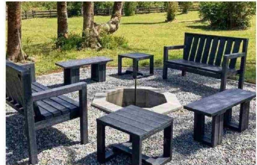
Eco Maderas es una empresa de Valdivia que desarrolla mobiliario urbano y doméstico a partir de plástico reciclado.