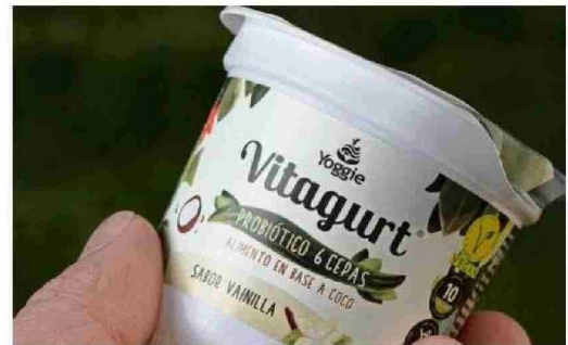
Vitagurt es una alternativa vegetal yogurt de la marca Yoggie que ofrece dos variedades: una proteica con lupino chileno y otra orgánica.

Innovación sostenible con impacto: cinco proyectos apoyados por IncubatecUFRO que están revolucionando la gestión de residuos, la regeneración ecológica, la agroecología, los alimentos sin alérgenos y el mobiliario urbano con economía circular.