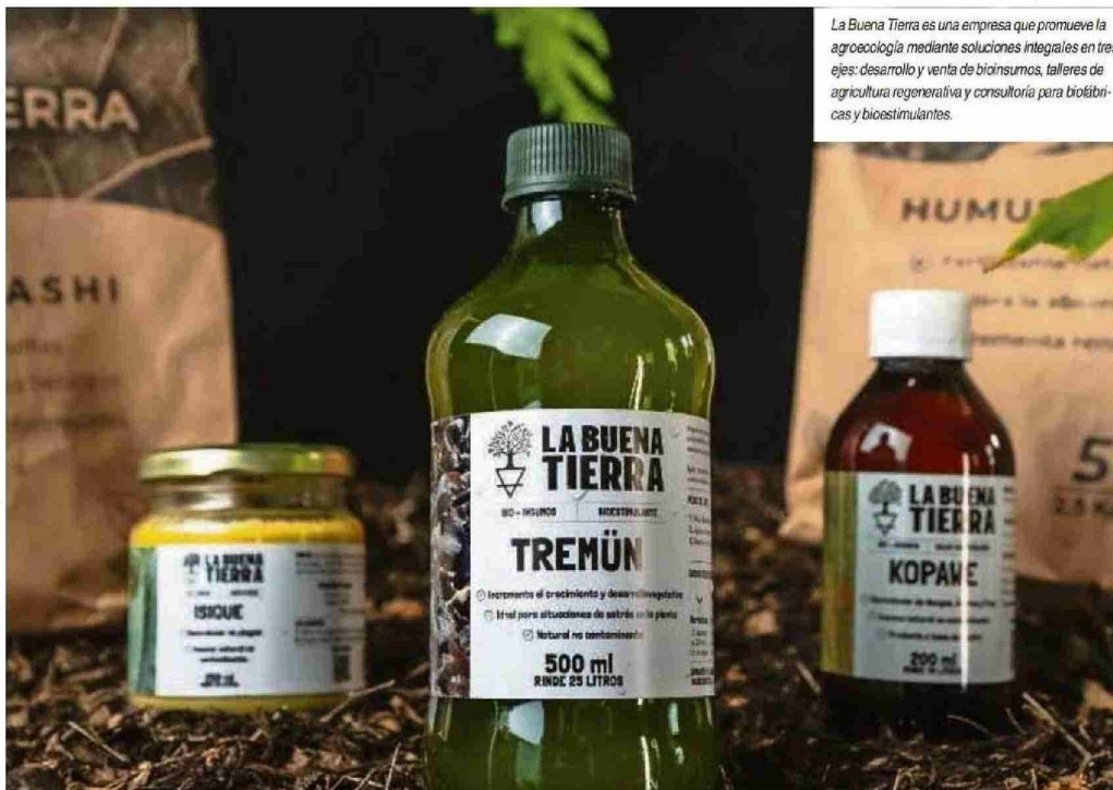
La Buena Tierra es una empresa que promueve la agroecología mediante soluciones integrales en tres ejes: desarrollo y venta de bioinsumos, talleres de agricultura regenerativa y consultoría para biofábricas y bioestimulantes.

Es una empresa de Valdivia que desarrolla mobiliario urbano y doméstico a partir de plástico reciclado, basándose en un enfoque sustentable y en economía circular al convertir residuos de diversos sectores industriales en muebles duraderos y de diseño atractivo, lo que la destaca como una alternativa sostenible a la madera convencional, ideal para jardines, terrazas y espacios públicos al generar productos que no necesitan mantenimiento, no se pudren con hongos ni insectos. Es un producto reciclado y también es reciclable.