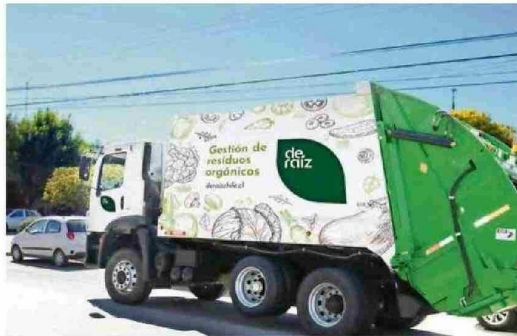
De Raíz transforma residuos orgánicos en compost, sustratos y nanobiofertilizantes mediante biotecnología avanzada y tecnología aplicada.