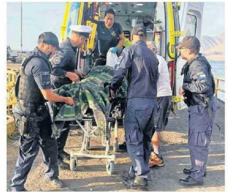
EL AFECTADO FUE TRASLADADO AL HOSPITAL DE TOCOPILLA.

Finalmente, cerca de las 19:35 horas, el tripulante accidentado fue desembarcado en el Muelle