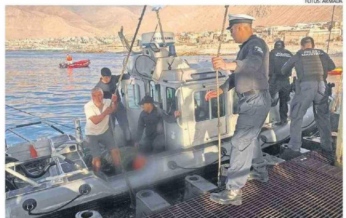
LA ARMADA UTILIZÓ LA "DEFENDER" PARA GARANTIZAR ESTE TRASLADO EN UN CORTO TIEMPO.

informó que "un tripulante había sufrido la amputación de su pie derecho mientras calaban artes de pesca 10 MN al SW de la ciudad, teniendo la intención de trasladar al accidentado hasta el muelle fiscal, para posteriormente llevarlo a un centro de salud", expresaron desde la autoridad marítima.