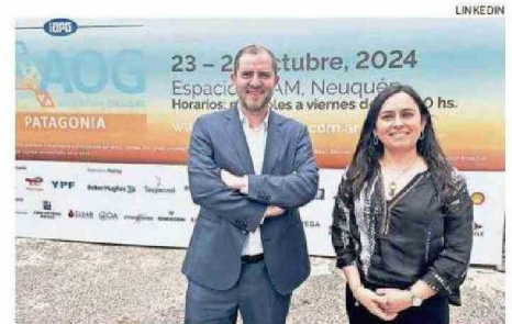
CABALÁ EN LA FERIA ARGENTINA OIL & GAS PATAGONIA 2024 (AOG).

En la actualidad, Gasoducto del Pacífico e Innergy tienen conectadas a su red de gasoductos a compañías de los sectores pesca, alimentos, forestal, energía, celulosa, metal-mecánica y distribuidoras de gas natural residencial y co-