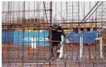
DURANTE SEPTIEMBRE SE AUTORIZÓ EDIFICAR 62.353 M 2 .