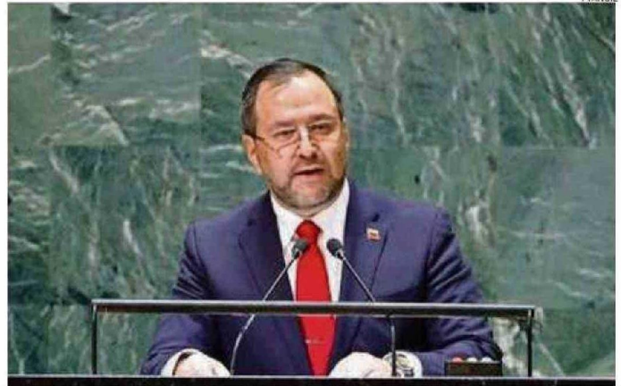
El canciller venezolano, Yvan Gil, dijo que Boric estaba "a la derecha de Milei".

Por su parte la ONG Provea dijo ayer que al menos 24 personas han fallecido en medio de las protestas en Venezuela. Esa cifra no ha sido confirmada por el régimen chavista.