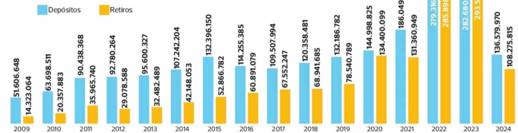
Depósitos versus retiros a junio de cada año En M$