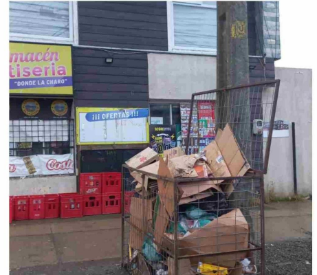
El efecto sobre el entorno de la comunidad es muy lamentable.