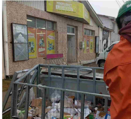
Pero al llegar los auxiliares de aseo el aspecto que estos ofrecen es muy diferente.