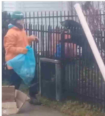
Otra dificultad son los perros, sobre todo, cuando el recipiente de basura está dentro de la casa.

“Se solicita vuestro apoyo para dar difusión y poder vivir en un entorno más limpio, dando protección y dignidad a nuestros auxiliares”.