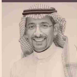
BANDAR IBRAHIM ALKHORAYE, MINISTRO DE INDUSTRIA Y MINERIA DE ARABIA SAUDITA.