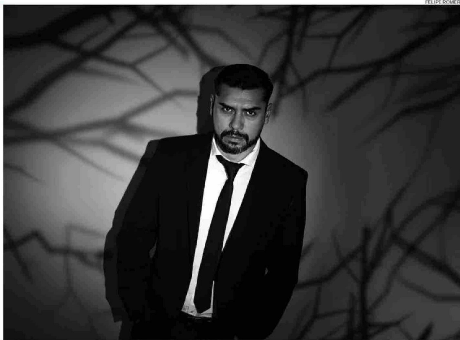
"ME DEMORO MUCHO EN INVESTIGAR, MESES, INCLUSO HASTA UN AÑO ESTOY INVESTIGANDO PARA MIS PROYECTOS", DICE EL AUTOR.

"Todos mis libros se basan en investigaciones. Yo no me demoro mucho en escribir, lo mío es la narrativa breve, me gusta como formato la novela (narración entre el cuento y la novela), pero, si bien me de-