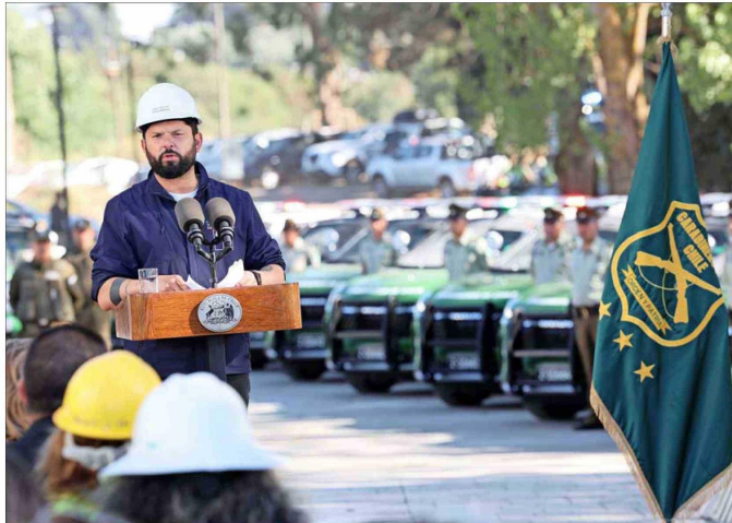
El Presidente Gabriel Boric se refirió a la detención de María Corina Machado —quien fue posteriormente liberada— en Concepción. Lo hizo al realizar una actividad de entrega de vehículos policiales a Carabineros del Biobío.

El Presidente relató a los asistentes ser "una persona de izquierda y desde la izquierda política les digo que el gobierno de Nicolás Maduro es una dictadura y tenemos que hacer todos los esfuerzos internacionales para que se restablezca la ley, la democracia. Todos los esfuerzos para que el pueblo de Venezuela tenga el derecho a decidir su propio destino; es la postura del Gobierno de Chile que hemos defendido desde un principio y