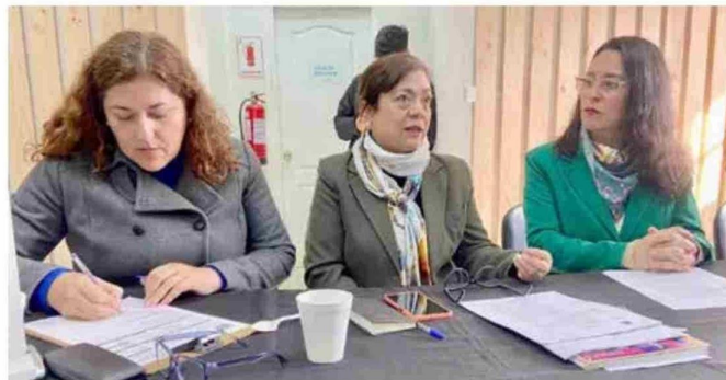
La idea es encontrar más colaboradores para aumentar la cobertura y entrega de alimentos.

En cuanto a sus colaboradores, destacan como donantes de alimentos Carnes De Solís, Congelados Alfé y Nisen, El Pedregal, Arrocería Santa Mónica, Molino El Peral, Hotel Curapalihue, Revolución Pyme,