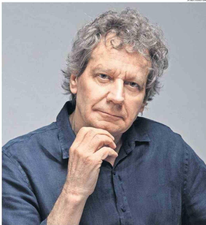
"ME PROPUSE RESPETAR TODOS LOS HECHOS CONOCIDOS DE LA VIDA REAL", DICE EL AUTOR.

"Hay una frase del poeta estadounidense Robert Frost ('Fuego y hielo') que dice que 'escribir poemas sin métrica es como jugar tenis sin red': mi red fueron los hechos, o sea, ella estuvo en un convento, yo no podía cambiar eso. Y eso te libera en cierto modo (...frente a decisiones como) ¿dónde se produce el primer beso? (...) Porque cuando estás escribiendo una novela dedicas mucho tiempo a definir los hitos, me pasó en 'La vida doble', una novela que toca el lado de los servicios de inteligencia en la dictadura, don-