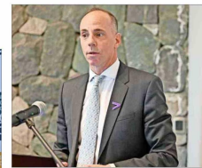
Nicolás Goldstein, presidente ejecutivo de Accenture Hispanoamérica, realizó la presentación "Liderazgo Sostenible: Derrribando Barreras", donde enfatizó la necesidad de superar los obstáculos tradicionales para integrar la sustentabilidad en el corazón de las estrategias empresariales.

"Nuestro objetivo es acelerar un crecimiento económico que no solo sea robusto, sino que también sea inclusivo y sostenible. Es vital que el sector privado y el público trabajen de la mano para alcanzar estos objetivos", dijo Nicolás Grau, ministro de Economía, Fomento y Turismo.