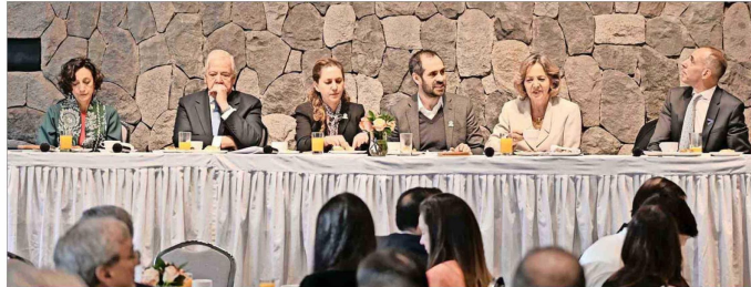
La jornada terminó con un diálogo abierto entre los panelistas y los asistentes, donde se discutió la integración de la sustentabilidad en las políticas públicas y empresariales.