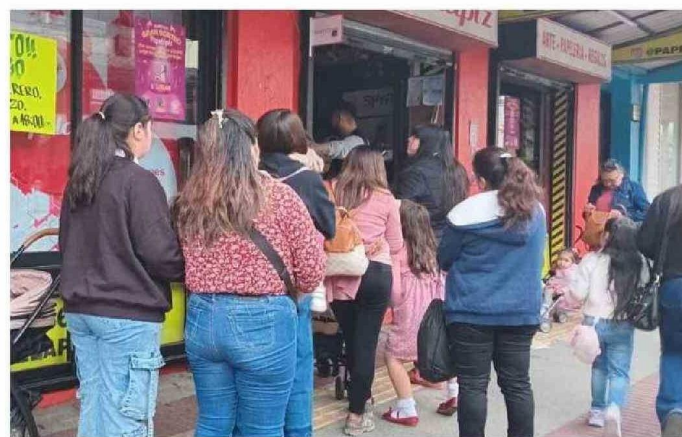
PARTE DEL COMERCIO CERRÓ, MIENTRAS USUARIOS ESPERABAN QUE EL SERVICIO VOLVIERA A LA NORMALIDAD.

Ante la magnitud del evento, se activó un Cogrid regional a las 16:00 horas en la capital regional para coordinar las res-