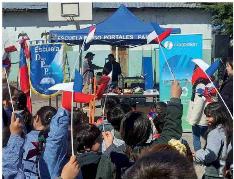
Representantes de Coopelan entregaron recomendaciones para un uso seguro de los volantines.

Especial acento se puso en no utilizar hilo curado que, ade-