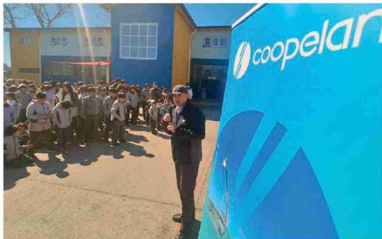
La campaña de Coopelan se realiza en las escuelas rurales dentro del área de influencia de la Cooperativa.

abarca a 35 mil clientes en las comunas de Los Ángeles, Santa Bárbara, Quileco, Mulchén y Laja, cuyas redes de distribución de energía eléctrica suman cerca de 4 mil kilómetros.