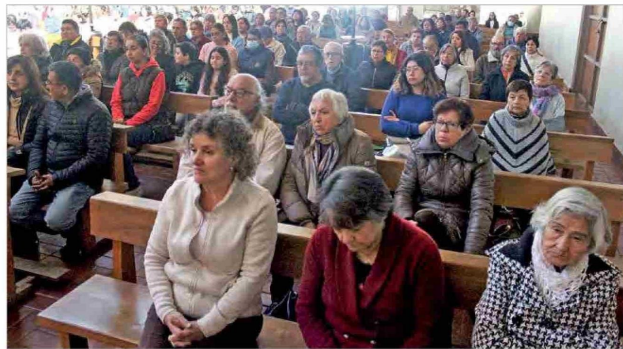
La conmemoración es de carácter religioso y busca honrar el nombre de la Madre, Reina y Patrona de Chile.