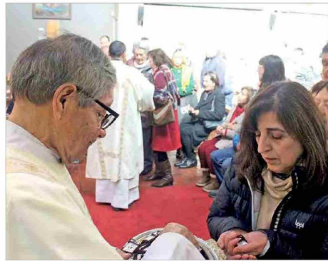
Con imposición de escapulario, parroquia Divino Maestro celebró a la carmelita.

La Parroquia Divino Maestro de Rancagua se unió a la celebración nacional del Día de la Virgen del Carmen donde decenas de fieles participaron en la imposición del escapulario, un rito cargado de simbolismo y compromiso espiritual.