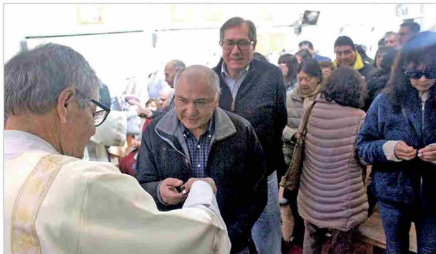
En la parroquia Divino Maestro se conmemoró el Día de la Virgen del Carmen.