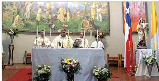
La Virgen del Carmen es considerada Patrona y Reina de Chile, Patrona de las Fuerzas Armadas y de Carabineros, devoción que viene desde la época colonial y se ha mantenido viva hasta la actualidad.