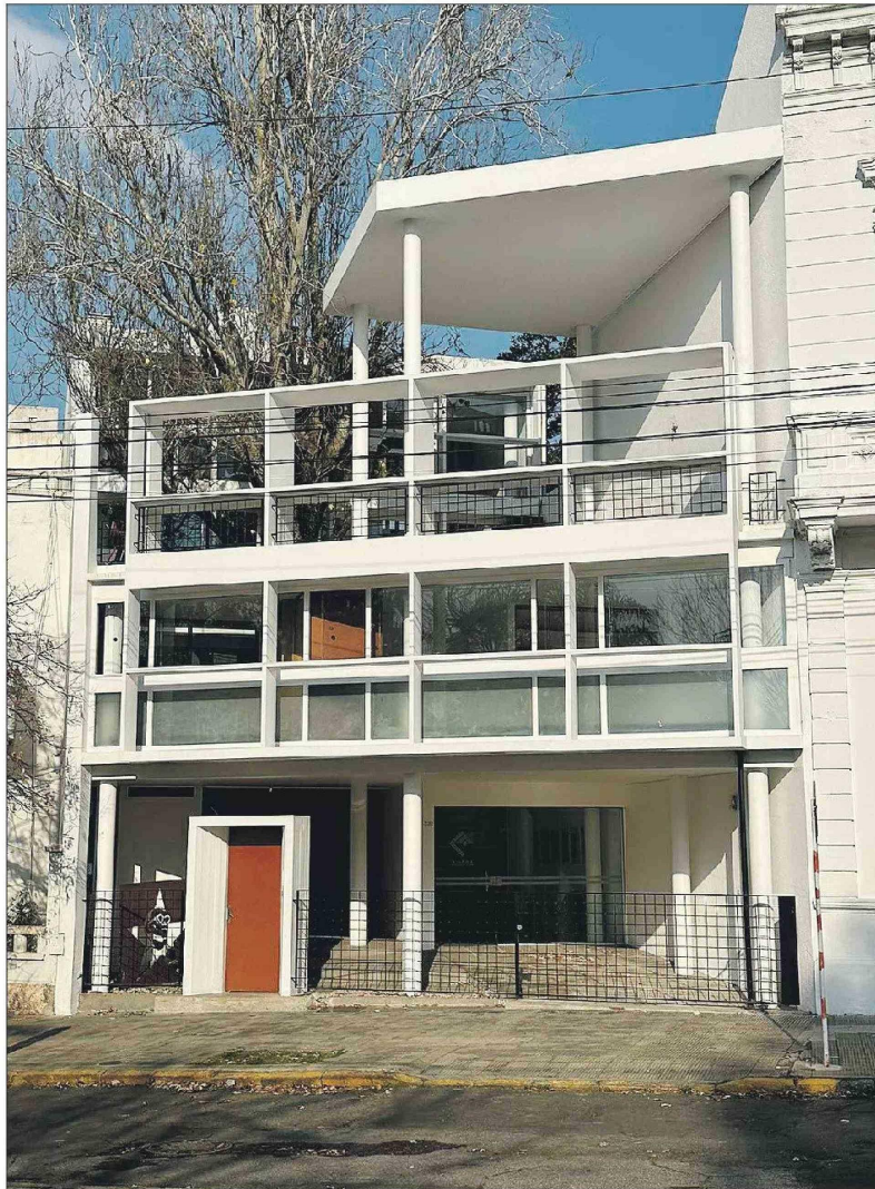
La Casa Curutchet, que hoy es un museo, se sitúa en La Plata, a 56 kilómetros de Buenos Aires.

4. Ventana corrida. Al haber liberado la estructura de la fachada, permite poner una ventana que recorre de la-