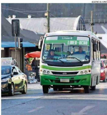
ADULTOS MAYORES DEMANDAN MAYOR CONECTIVIDAD EN TRANSPORTE.

los condominios de viviendas tuteladas, centros diurnos comunitarios, fondos de subsidios Eleam, Eleam Senama, y cuidados domiciliarios, de la mano con las unidades que cuidan", explicó Morales, con el objetivo de promover un envejecimiento digno, activo y saludable.