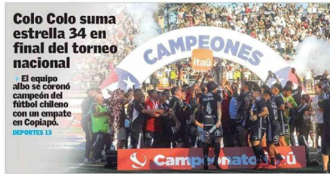
Colo Colo suma estrella 34 en final del torneo nacional El equipo albo se coronó campeón del fútbol chileno con un empate en Copiapo. DEPORTES 13