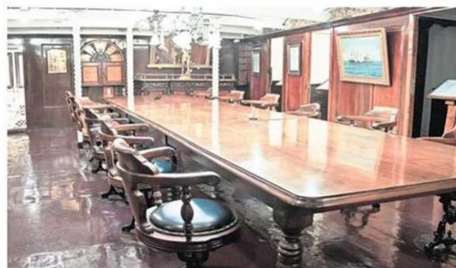
Cada cuatro años se hace una mantención intensa, que incluye el exterior y los elementos interiores, como el mobiliario.