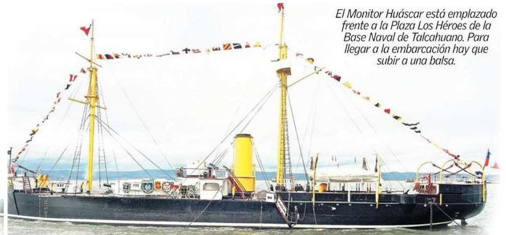
El Monitor Huáscar está emplazado frente a la Plaza Los Héroes de la Base Naval de Talcahuano. Para llegar a la embarcación hay que subir a una balsa.

En abril las labores se centraron en la recuperación del Huáscar, lo