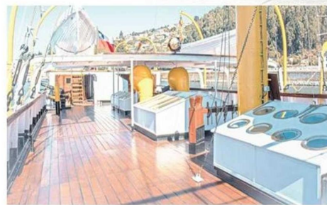
Dentro de los trabajos se incluyó el reemplazo de la cubierta de madera, además de la normalización del sistema eléctrico.

para orientar a los visitantes, dijo que se mantendrán las cinco personas que están a cargo de la mantención y seguridad, más los funcionarios de apoyo que guían los recorridos.