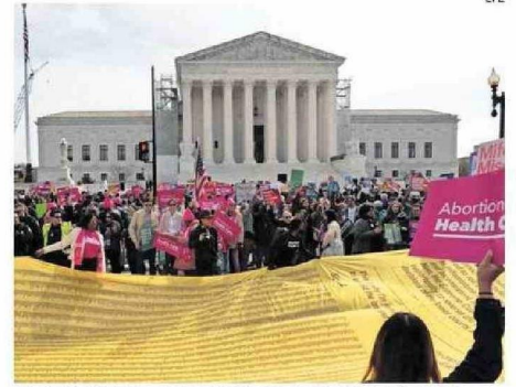
ORGANIZACIONES CIVILES CELEBRARON LA DETERMINACIÓN JUDICIAL.