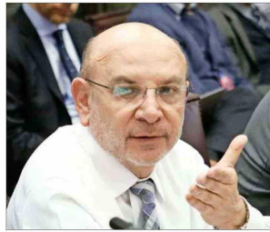
Juan Luis Castro, senador del P. Socialista.