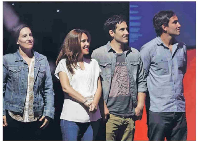
Los herederos del expresidente Sebastián Piñera.