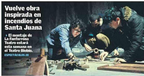
Vuelve obra inspirada en incendios de Santa Juana El montaje de La Fanfarrona Teatro estará esta semana en el Teatro Biobío. ESPECTÁCULOS 20