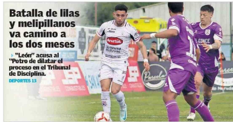
Batalla de lilas y melipillanos va camino a los dos meses "León" acusa al "Poño" de dilatar el proceso en el Tribunal de Disciplina. DEPORTES 13