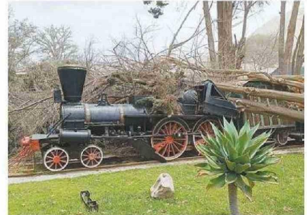
RESTAURACIÓN DE LA HISTÓRICA LOCOMOTORA INCLUIRÁ UN MUSEO.

El rector, en todo caso, no entregó fechas concretas para la materialización del proyecto museográfico y de restauración histórica.