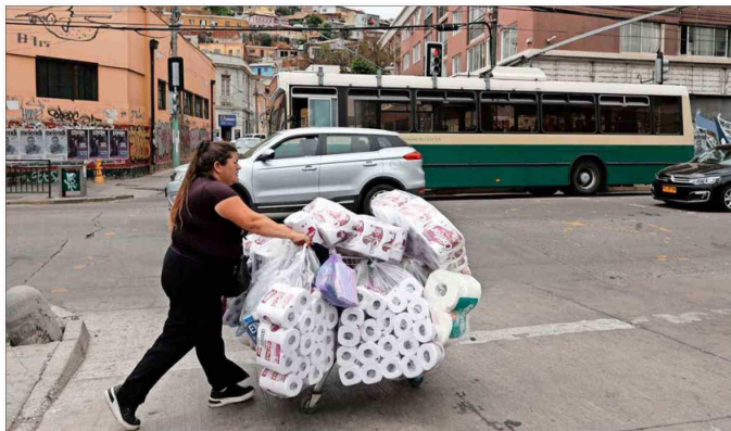
Por rama de actividad económica, el 36,4% de las microempendedoras ejerce en el comercio, mientras que el 25,5% de los microempendedores lo hace en ese sector.

Otra arista donde se manifiesta el deterioro en el último año es en un importante aumento de la prevalencia de subempleo. De total de microempendedoras, el 30,6% se encuentra en alguna forma de subempleo, en tanto que en los hombres es el 22,3%. El subempleo es cuando una