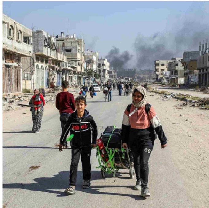
► Palestinos desplazados huyen de zona norte de Gaza, el 12 de noviembre de 2024.

Entre los acusados más destacados de la CPI figuran el presidente ruso, Vladimir Putin, acusado de deportar ilegalmente a niños de Ucrania; el exdictador sudanés Omar al-Bashir, acusado de genocidio y otros crí-