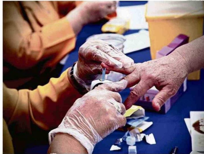
UNA PERSONA DE LA TERCERA EDAD SE SOMETE A UN EXÁMEN DE DIABETES EN FERIA PREVENTIVA.

Por otro lado, la diabetes tipo 2 se produce debido a una pérdida progresiva de autoin-