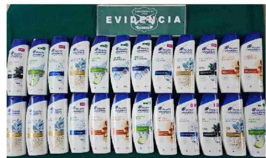
EFFECTIVOS POLICIALES recuperaron más de 20 envases de shampoo que habían sido sustraídos desde una farmacia.