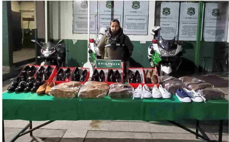
LOS ZAPATOS RECUPERADOS por la SIP fueron avaluados en 650 mil pesos.

Ello, tras ser sorprendido con más de 20 envases de shampoo que habían sido sustraídos desde una farmacia Cruz Verde, ubicada en calle Colón, al llegar a Rengo.