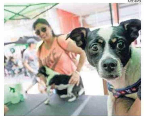
LLAMAN A ESTAR ATENTOS A POSIBLES SÍNTOMAS DE PARVOVIRUS EN CANES.